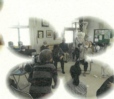
玉入れ、皆さん、必死!